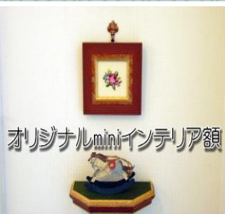
オリジナルminiインテリア額